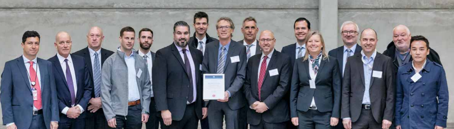
Les représentants de: Airport, IATA, expéditeurs, Handling Agents et Carriers, d' EAP et de CEIV-Community