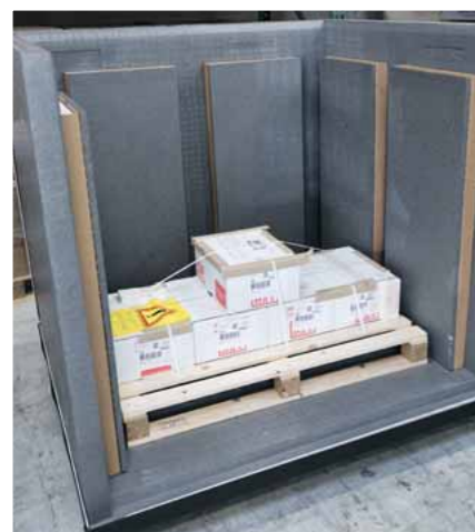
Le conteneur réfrigéré spécial est équipé d'éléments de refroidissement