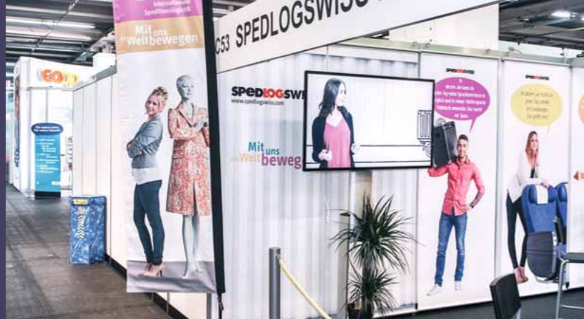
Le stand SPEDLOGSWISS à la foire de Bâle 2018