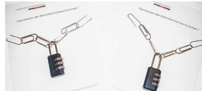
Symbol pour «assurer ensemble la relève professionnelle»