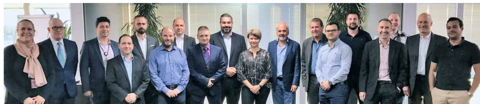
Photo de fondation IG Cargo