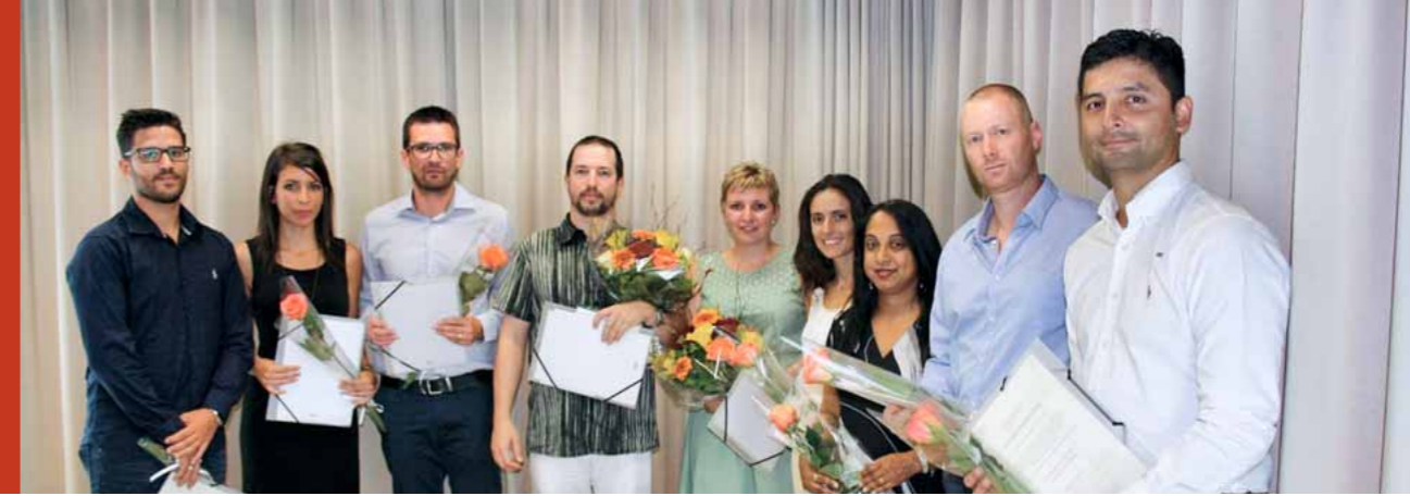
Tous les diplômés se réjouissent