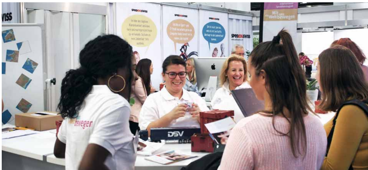
Toutes de bonne humeur...

La prochaine Foire professionnelle se tiendra en 2019, à nouveau dans le canton de Bâle-Campagne, du 23 au 27 octobre 2019 dans le Kultur- und Sportzentrum Pratteln. D'autres informations sous: www.berufsschau.ch