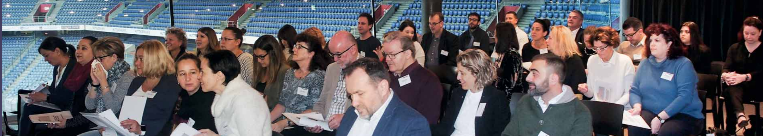
Dans le plenum