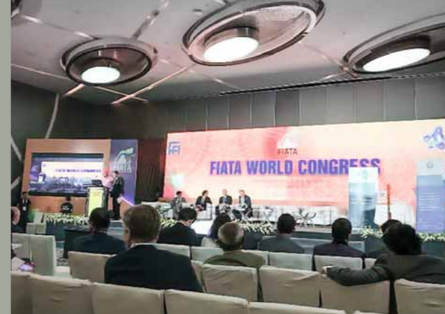
Salle de conférence dans le centre de congrès