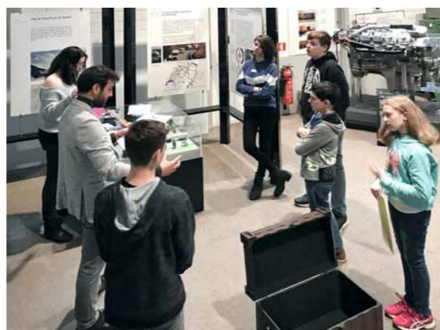
Les élèves pendant le parcours éducatif dans la Verkehrsdrehscheibe Schweiz

Pour finir chacun a pu choisir un petit «Give-Away» et rentrer chez lui avec beaucoup de nouvelles impressions. C'est ainsi qu'on peut parler à nouveau d'événement réussi. Un grand merci à toutes celles et tous ceux qui nous ont aidés!